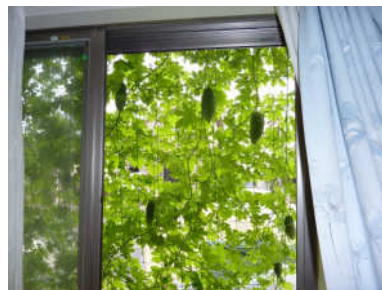
【外を眺めたところ】

日陰になった部屋は、他の部屋に比べてひんやりとしていて、グリーンカーテンの効果があったように思います。適度な明るさもあり、また、外からの目隠しにもなりました。