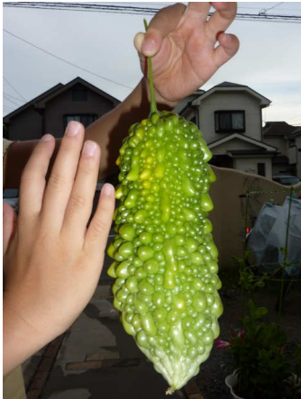
【小3の子供の手と比べて】

日陰になった部屋は、他の部屋に比べてひんやりとしていて、グリーンカーテンの効果があったように思います。適度な明るさもあり、また、外からの目隠しにもなりました。