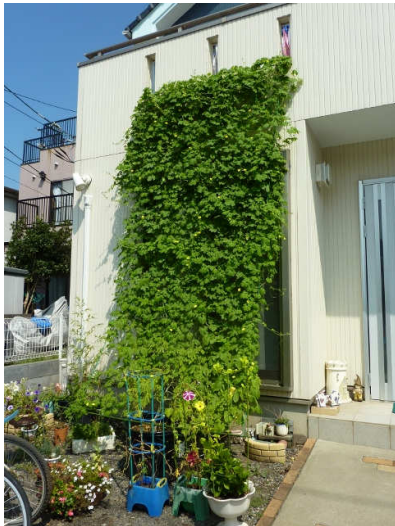
【ネットいっぱい育った】