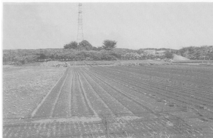
【写真：青梅インターチェンジ周辺の集約的農地】

「農業振興地域農用地区域」は、「農業振興地域の整備に関する法律」にもとづき、農地を保全するとともに、土地利用との調整を図りながら、農業近代化のために公共投資や農業施策を集中させる地域として指定される「農業振興地域」のうち、農地、採草放牧地、混牧林、畜舎用地および用排水路、農道など農業経営に必要な施設用地を「農用地区域」として指定し、その保全・有効活用を図るものです。