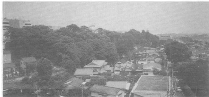
【写真：河岸段丘の崖線樹林】

良好な樹林地や水辺地、史跡などの歴史的遺産と一体となった緑地などの保全を図るため、昭和47年に制定されました。この条例では、緑地保全地域のほか、歴史環境保全地域、自然環境保全地域の指定を推進しています。青梅市では、立川崖線緑地保全地域のほか、勝沼城跡歴史環境保全地域が指定されています。