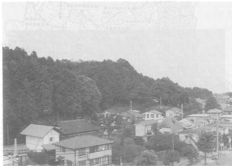
【写真：勝沼城跡歴史環境保全地域】

「歴史環境保全地域」とは、東京における自然の保護と回復に関する条例にもとづき、社寺・城跡・遺跡などと一体となった伝統的・文化的意義をもつ緑地および自然環境の保全を図るため、東京都が指定する緑地保全制度です。指定区域内では、建築物の新改築・宅地造成などの土地の形質変更、樹木の伐採・水面の埋立てなど緑地の保全に著しく影響を及ぼす行為が規制されます。