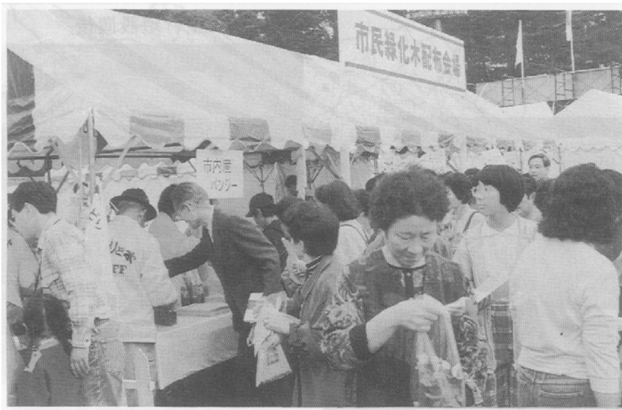
【写真：産業観光まつりにおける緑化活動のPR】

花壇や生け垣の設置、庭木の手入れなど、民有地の緑化に関する知識の指導や技術の普及により、民有地の緑化を促進していきます。また、イベントなどの開催時には緑化活動をPRします。