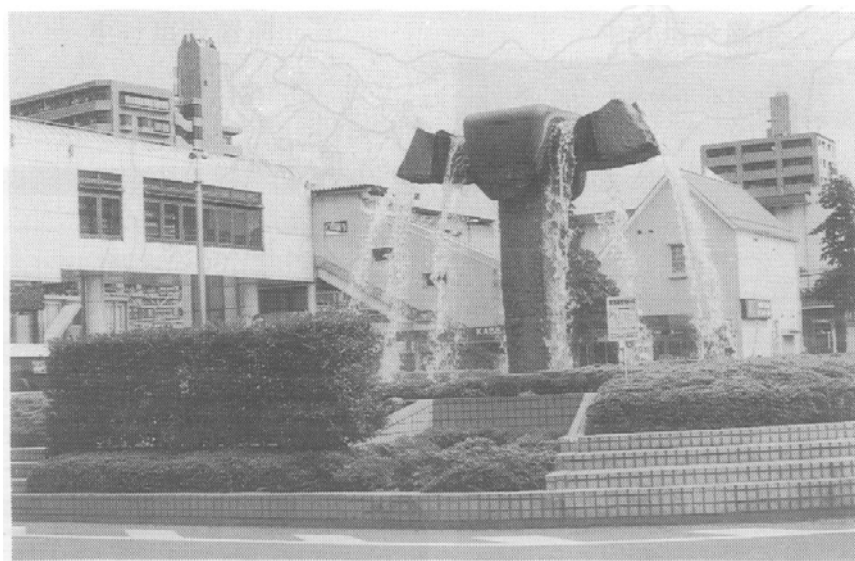
【写真：JR青梅線河辺駅前の植え込み】