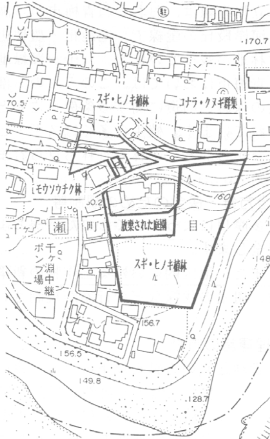
(千ヶ瀬町6丁目地内)