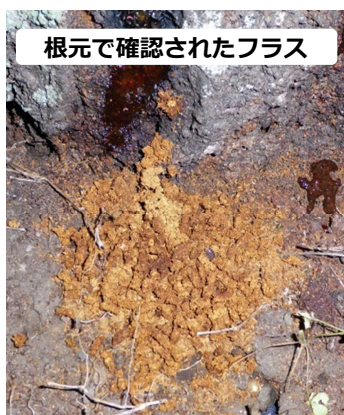
根元で確認されたフラス

6月~9月に、下の写真のような『フラス』(幼虫が排出する木屑と糞が混ざったもの)が出ていないかを確認して下さい。 点検するポイントは右の写真を参考にして下さい。