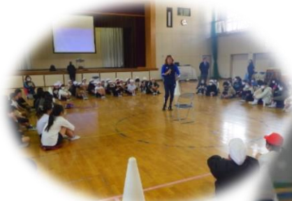
あきらめないことが大切です

小学校入学前は野球をやっていましたが、1年生から父親の勧めでサッカーを始めました