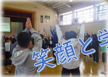
笑顔と学びの体験プロジェクト