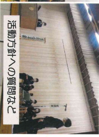
活動方針への質問など