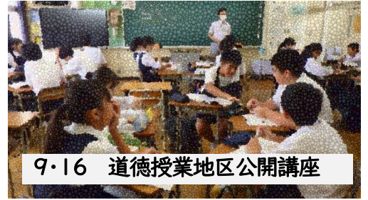
9・16 道徳授業地区公開講座

今夜は、中秋の名月。鈴虫の音に耳を澄ませば、本格的な秋の訪れを感じることができるといえるでしょう。秋は、暑さが和らぎ、過ごしやすくなることで、身体全体のコンディションを整えやすく、何事にも挑戦し易い季節でもあります。10月2日から2日間、中間考査が行われます。考査後からは、10・21合唱祭(福生市民会館)へ向け、本格的な取組が開始されます。すでに、合唱祭実行委員会は、昨年度の成果を超えるために頑張ってくれているので、大いに期待できます。