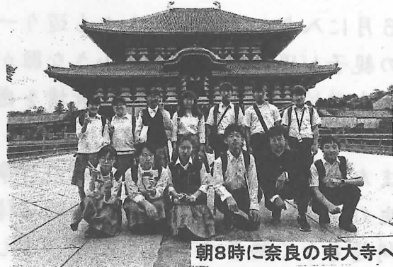
朝8時に奈良の東大寺へ

5月18日(金)~20日(日)まで、3年生が京都・奈良への修学旅行に出かけました。1日目は伏見稲荷、平等院、奈良公園などの奈良散策、2日目は班行動で奈良から京都にきて、三十三間堂、銀閣寺、南禅寺などの東山方面に、3日目はタクシ一行動で北野天満宮、金閣寺、龍安寺や嵐山方面に散策に出かけました。事前学習の通り学習を深めたり、友人との思い出作りがしっかりとできました。