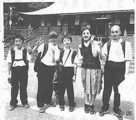
班行動で川越の喜多院へ

5月29日(火)、1年生は飯能に集合し川越への校外学習に出かけました。班行動で事前学習した喜多院や川越本丸御殿などを見学し、菓子屋横町でお土産も買うことができました。中学生になって初めての班行動で多くのことを学びました。