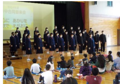
小中合同音楽会 六中生の全員合唱