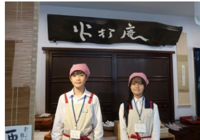
職場体験 和菓子店「火打庵」(東青梅)売り場