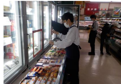
職場体験 マルフジ東青梅店