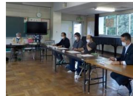
第2回学校運営協議会(七小・六中合同)