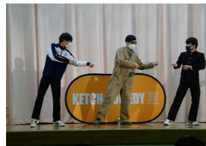
ケッチさんとロープ引きをする生徒