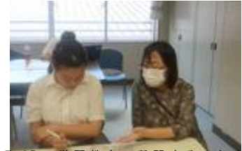
8月25日学習教室で質問する2年生