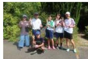
8月6日黒沢川清掃参加の生徒達