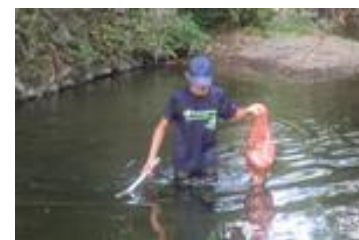
8月6日黒沢川清掃参加1年生