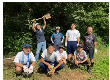
8月22日第七小ビオトープづくり