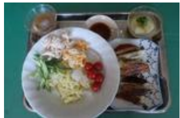
7月24日の家庭科調理実習補習の冷やし中華と餃子