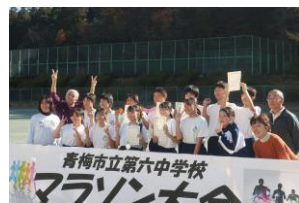
マラソン大会参加2年生

●11月28日(火)に 第60回マラソン大会 がありました。長年にわたり続けてきました本大会は60回を迎えました。おめでとうございます。今回も実行委員の2年生 君・ 君、1年生 さんを中心に準備を進め、朝練習も11月21日からはじめました。大会当日は欠席ゼロで全員が完走しました。2年生 君は13'20(距離3.6km)を記録し、男子歴代2位を達成しました。男子歴代1位は平成27年度2年生 君(12'51)でした。生徒の皆さんは今季急激に冷え込んできたグラウンドの寒さの中で自分の目標を明確にして継続的に努力を続け、多くの生徒が自己ベストの更新を果たしました。監察としてご協力いただいたPTA役員、民生児童委員の皆様、厚沢御嶽神社の宮司さんに見守られながら花木園の前を通り厚沢御嶽神社で折り返して学校に戻ってきました。小曾木・黒沢駐在所のパトロールも入り、安全確保も万全の体制でした。沿道からの声援を含めましてご協力いただきました地域・ご近隣の皆様には感謝申し上げます。この日のマラソン大会の完走は、生徒達に深い達成感をもたらし、これからの大きな成長につながっていくと確信しています。