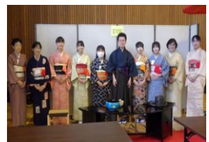
茶道部のメンバー