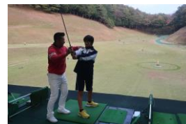
渡辺プロによるレッスン

「初めは中々、当たらず空振りをしたり、何もわからず、打ち続けていましたが、アドバイスをもらい当たるようになり、ある程度距離も飛ぶようになりました。～思い切り楽しんでゴルフを体験することができました。」(2年女子) (体験教室の様子は西の風新聞11/9、西多摩新聞11/17で紹介されました。多摩ケーブルネットワークでも12/30に放映予定です。ぜひご覧ください。)