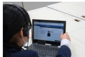
スタディサプリの動画講義