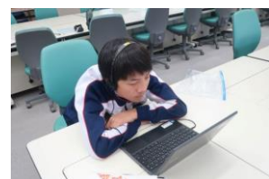
学習教室でのタブレット活用