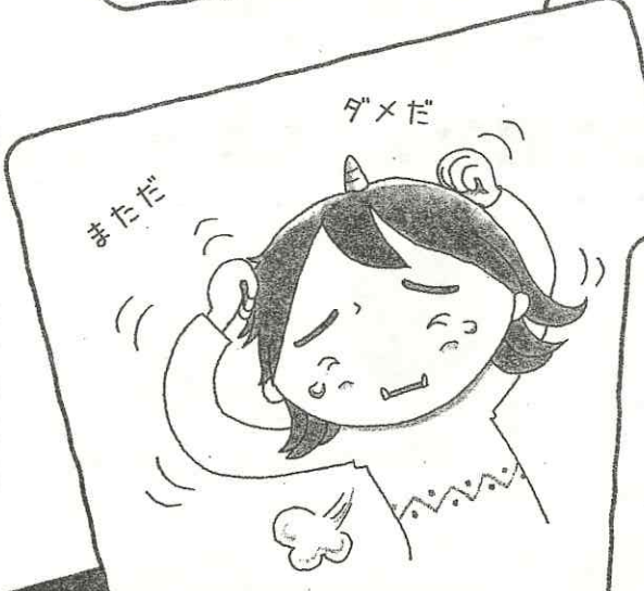
自分のことが嫌いになりそうとき