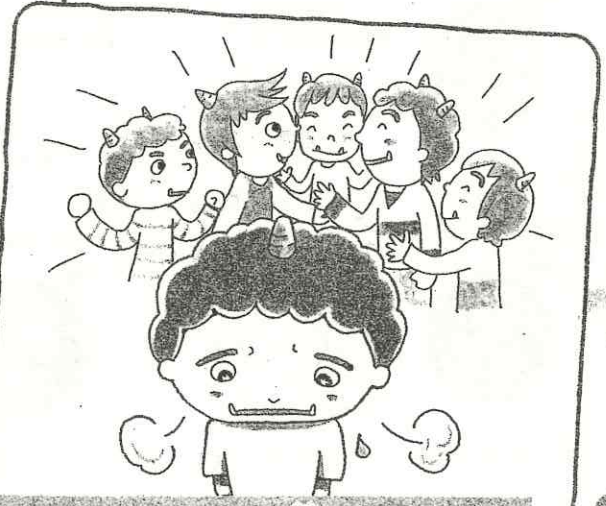
ひとりぼっちだと思ったとき