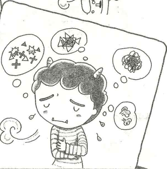
悩みが頭からはなれないとき