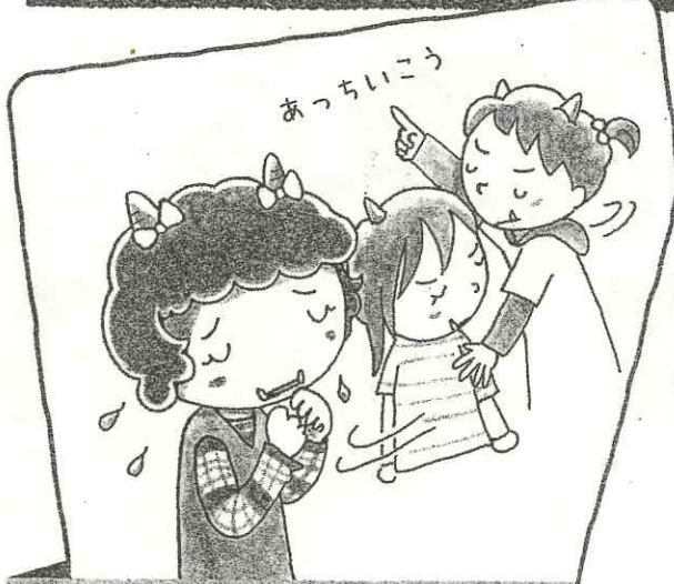
受け入れてもらえなかったとき