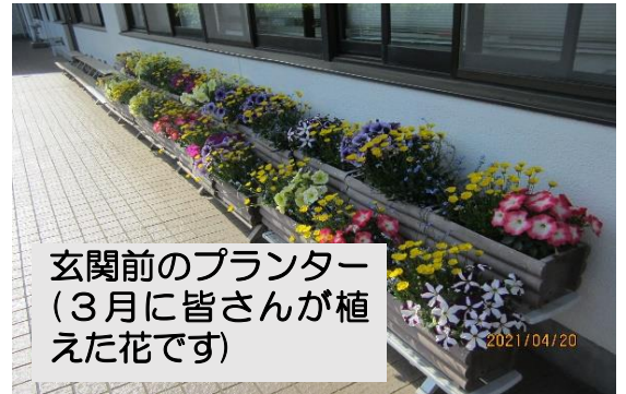
玄関前のプランター (3月に皆さんが植えた花です)

東小中学校の皆さん お元気ですか。皆さんと交わした挨拶、音楽室での授業、クラブ活動、行事、そして儀式。東小中での思い出は、私の宝です。これからも元気で頑張ってください。ありがとうございました。