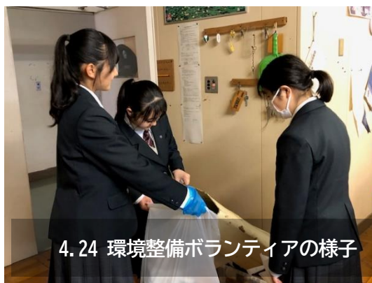
4.24 環境整備ボランティアの様子

新しい気持ちでスタートした4月。慣れない環境の中で人間関係をうまく作りながら、泉中生はとても頑張っています。