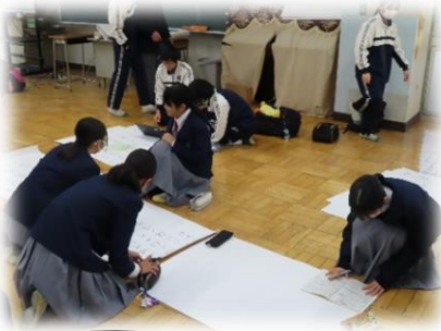
歌詞カードの作成