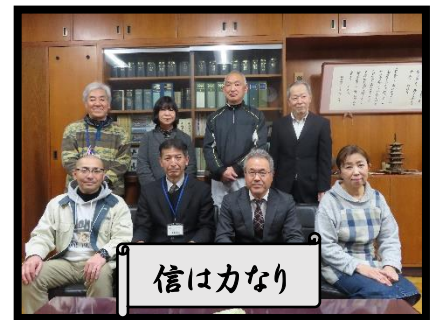
校長. 副校長. 事務. 用務. その他

本校のホームページにアクセスすることのできる QR コードを掲載します。ぜひご覧ください。