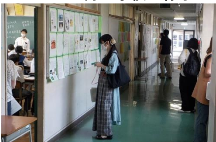
7/9授業公開の様子 211名の保護者等の参観をいただきました。有難うございました。 上:1年フロアー 下:2年セーフティ教室