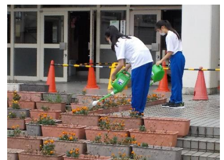
夏休みのボランティア活動 暑い中を有難うございました。可憐なお花はその姿で感謝を表していました。 上:お花へのみずやり 下:図書室の整備