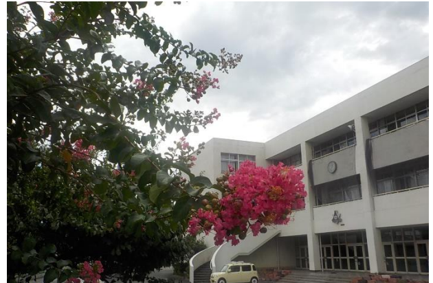
サルスベリとマリーゴールドが映える新町中学校

今回の夏休みは普段と違って自分を成長させたり、自分なりに良かった（悔しさ等も含めて）、精神的に満たされたりと感じた部分があったと思います。そういう実感がなくても、社会に出て中学時代の夏休みを振り返ったとき鮮やかに蘇る思い出があると信じています。この夏休みは、これまでの努力のかいがあってやっとの思いで手に入れた都大会出場を果たした部がありました。惜しくも1回戦で敗退、3年生の選手に涙があふれていました。それぞれの価値ある夏休みがあったと拝察します。夏休みは終わりましたが、成長はまだ続きます。本当の成長はこれからだと思っています。夏の柿はまだ青いです。これからもっと大きくなって色づいていきます。