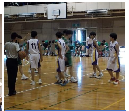
男子バスケットボール部 7/24 都大会出場、日野三中との 一戦の様子