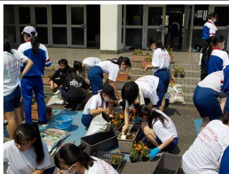
7/2環境整備ボランティア活動 PTA主催の下、130名を上回る生徒等の参加がありました。有難うございました。 上:花壇づくり(昇降口前) 下:資源ごみの回収