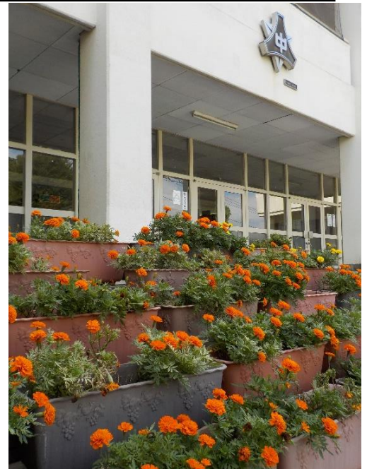
マリーゴールドが映える新町中学校 ※PTA 主催の下、生徒がボランティアで植栽・管理したおかげで、美しく咲き誇っています。

前号では、全国学力調査結果等を踏まえ、学校経営方針に基づき、授業の質的変換「教わる⇒自ら学ぶ」すなわち、自立的・対話的で深い学びとなる授業が進行中であることをお伝えしました。また、授業での努力は教師も生徒も大切ですが、同学力調査を意識した時、これに耐えうる学力を授業だけで獲得することが現実的に厳しいことから、家庭で授業を振り返りまとめたり、授業で興味が出てきたところをもっと調べたりする「ノートまとめ」をお願いしてきたところです。この「ノートまとめ」は1・2年生、5教科（国・社・数・理・英）を中心に10月から本格化させます。同学力調査で求められる学力は、今と未来に生きていく上で必要な力と定義されています。改めてご家庭でも、生徒の自立的・主体的となった学習となるようご指導をよろしくお願いいたします。さて、この生徒の「自立」とか「主体」は、教科授業だけで求められるものではありません。全ての学校生活の中で実現していかなければいけないと考えています。それは今も未来も変革の時代、いわゆる VUCA 時代※が続くと思われるからです。これまでのように保護者や先生の言う