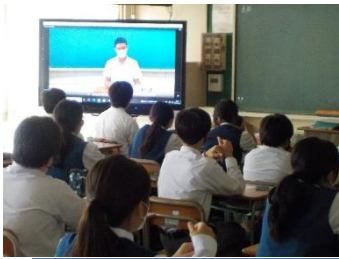
生徒会選挙 9/22 立候補者の演説と投票の様子:3年の投票では青梅市選挙管理委員会から実際の投票箱を借りて行われました。