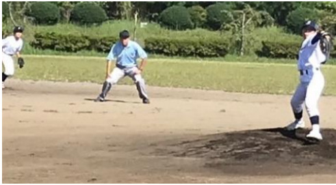
野球部 (新町中・吹上中合同チーム) 9/11 平井中(日の出)との一戦の様子