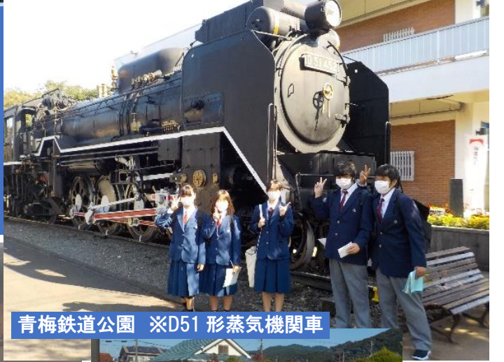
青梅鉄道公園 ※D51 形蒸気機関車