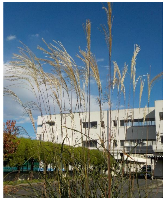
新町中の秋を満喫するススキ