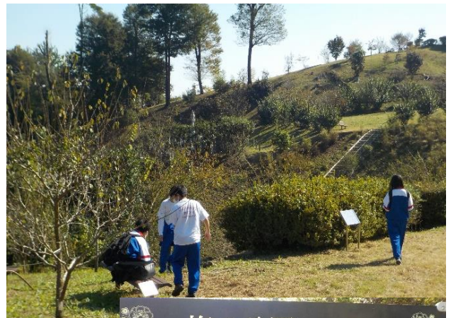
梅の公園 Plum Park