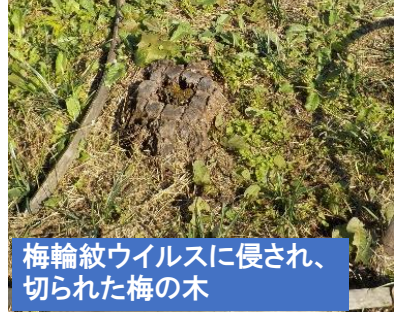
梅輪紋ウイルスに侵され、切られた梅の木