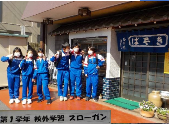
第1学年 校外学習 スローガン