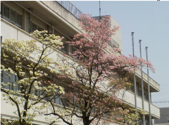
満開を迎えた新町中校庭のハナミズキ