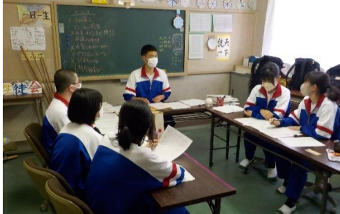
生徒会本部 / 各専門等委員長