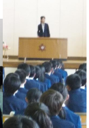
校歌を全員で歌い別れを告げることができました