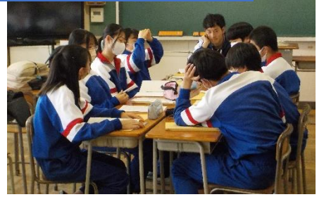
3年学級委員会 / 給食委員会