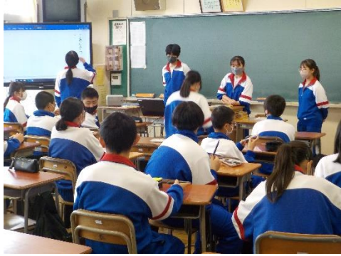
生活委員会 / 2年学級委員会