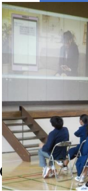
1・2年セーフティ教室(情報モラル教育) 青梅警察署スクールサポーターによる講演

学校公開・セーフティ教室 5/13～保護者様等のご参列を多数いただき有難うございました。