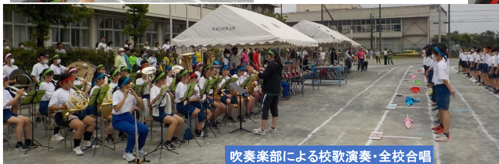
吹奏楽部による校歌演奏・全校合唱