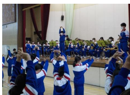
全体練習～あいにくの雨で体育館でしたが立派でした