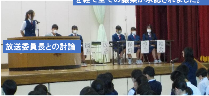
放送委員長との討論