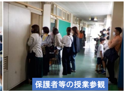
保護者等の授業参観