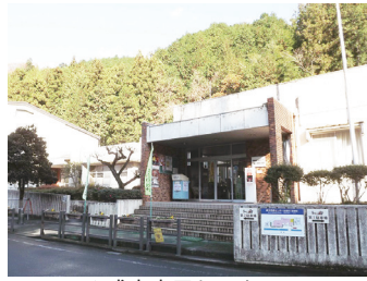
△成木市民センター

電源立地地域対策交付金とは、発電施設が設置されている自治体に対し、発電施設の周辺地域における公共施設の整備や住民福祉の向上等を目的として交付されるものです。