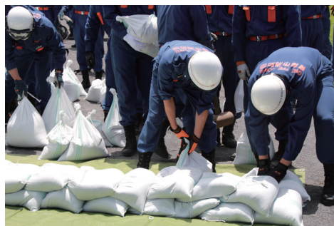
青梅消防署・市消防団による合同水防訓練の様子