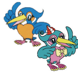
ウェイキー&リップル

☆5日(祝)まで…第27回多摩川さつき杯 ☆9日(土)～14日(木)…第31回日本モーターボート選手会会長賞 ☆24日(日)～29日(金)…ヴィーナスシリーズ第5戦は政プリンセスカップ 電話投票会員募集中 電話 ☎0120-858-006でレポート加入受付センターへ