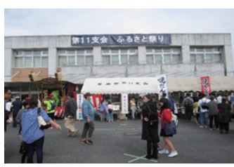
令和元年度ふるさと祭りの様子