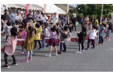
令和元年度ふるさと祭りの様子

しかし、近年は他の支会と同様、自治会の加入率が急速に減少し、自治会組織活動に少なからず影響を及ぼしています。 東日本大震災をはじめとした大きな震災や昨年の風水害など、大規模な災害が発生しています。さらに、新型コロナウイルス そのような中、第11支会でも防災訓練、盆踊り、ビーチボール大会、運動会、ふるさと祭り、市民ウォーキング等さまざまな行事を通じ、地域の絆を深めていこうと会員の方々が日々奮闘しています。 霞川に飛来するカワセ