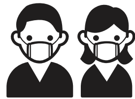
乗車時のマスク着用