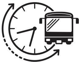
時差通勤・通学の活用

西武バスから皆さまへ厚生労働省及び日本バス協会の指針・ガイドラインに基づくウイルス感染症対策のお願いです。