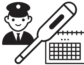
乗務前の体調確認・健康管理