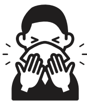
咳エチケットの実施