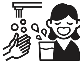
乗車前後の手洗い・うがい