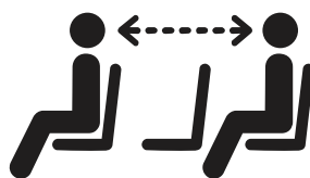
閑散時の間隔をあけた着席