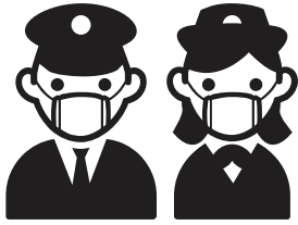
従業員のマスク着用

厚生労働省及び日本バス協会の指針・ガイドラインに基づいて、西武バスでは以下のようなウイルス感染症対策を実施中です。