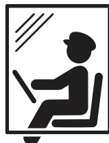
運転席周りの ビニールカーテン設置