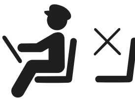
「密集」しやすい 前方の座席封鎖