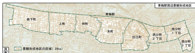
図1 青梅駅周辺景観形成地区の範囲

市では、「美しい風景都市・青梅」を目指し、優れた景観を持つまちづくりを進めるため、「青梅市の美しい風景を育む条例」に基づき、建築行為等について届け出を義務付けています。なお、重点的に景観形成を図る地区として指定している「青梅駅周辺景観形成地区」(図1)および「多摩川沿い景観形成地区」(図2)では、届け出の対象が異なります。