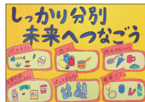
小学5年生の部金賞