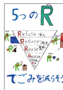
小学4年生の部金賞