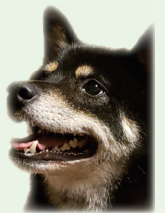
実施動物病院一覧（動物病院名の50音順に掲載）

※市役所でも例年同様、鑑札、済票を受けることは可能です。（交付手数料は同額です） 注意事項 ▽令和3年3月15日までに登録した犬の飼い主：市から送付された「令和3年度狂犬病予防集合注射について」と記載されたハガキ（オレンジ色）を必ずお持ちください。 ▽3月15日以降に登録した犬の飼い主：ハガキが送付されないことが