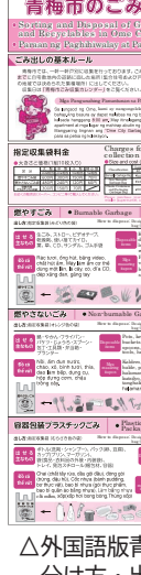
△外国語版青梅市のごみと資源物の分け方・出し方

③1級の精神障害者保健福祉手帳の交付を受けている方の 帳の交付を受けている方も可、2年1月1日現在の住所地で取得してください）が必要で