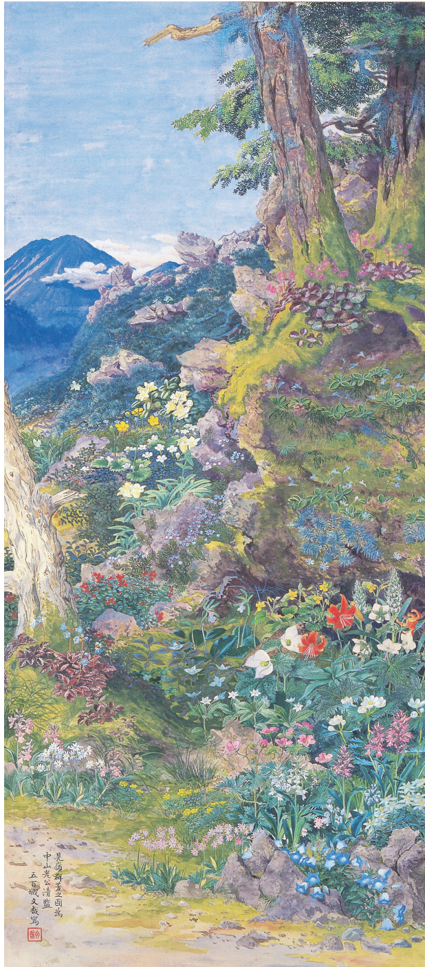
五百城文哉《見嶺群芳之図》絹本／水彩 明治中期、通期展示、水戸市指定文化財

水戸市出身の五百城文哉（1863～1906年）は、明治時代に活躍した洋画家です。その作風は文字通りの「写生」であり、丹念に描かれた風景画や植物画は、水彩画特有のみずみずしさを保ちつつも、見る者を圧倒するような、カラー写真を凌駕する出来映えを誇っています。