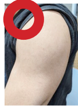
△肩の出しやすい服装