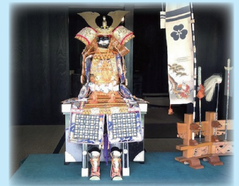
△旧宮崎家住宅で展示する鎧飾り