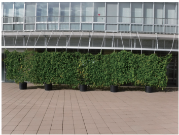
△みどりのカーテン