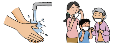
〈厚生労働省ホームページ参照〉