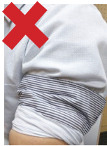
△肩の出しにくい服装

服装 Tシャツ、タンクトップ、ノースリーブなどすみやかに肩を出せる服（右写真参照）