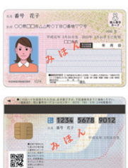
マイナンバーカード見本

封されたもの、または地方公共団体情報システム機構から送られたもの) ※お手元に申請書がない場合、身分証明書をお持ちください。