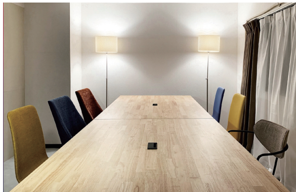
△師岡町「青梅コワーキングスペース」