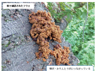
樹皮・幹に付着したクビアカツヤカミキリ