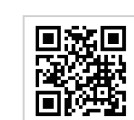
市議会ホームページ

インターネットでライブ・録画中継をしており、パソコンのほか、スマートフォンやタブレット端末でもご覧いただけます。