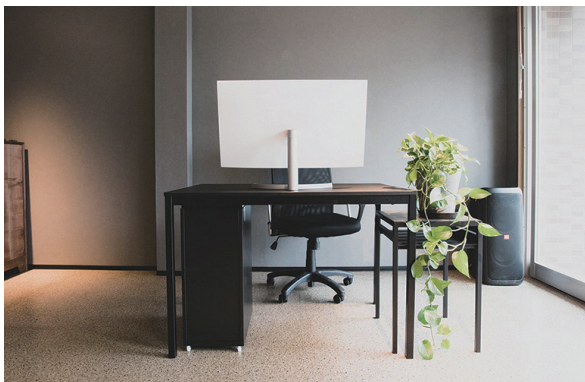
△西分町「WORK at ome」