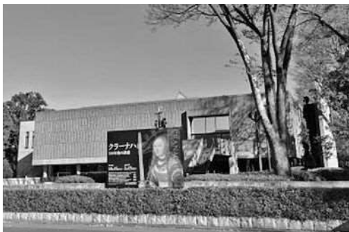
世界遺産に登録された ル・コルビュジエ設計の 国立西洋美術館本館

地下の特別展では「クラナハ展Ⅱ五〇〇年後の誘惑」が開催されています。私はクラナハのことは知りませんでしたが、思いのほか親しみを感じ、一点一点じっくり見入っていました。五〇〇年たったとは思えないくらい色鮮やかで新鮮なことに驚き、興味深かったです。