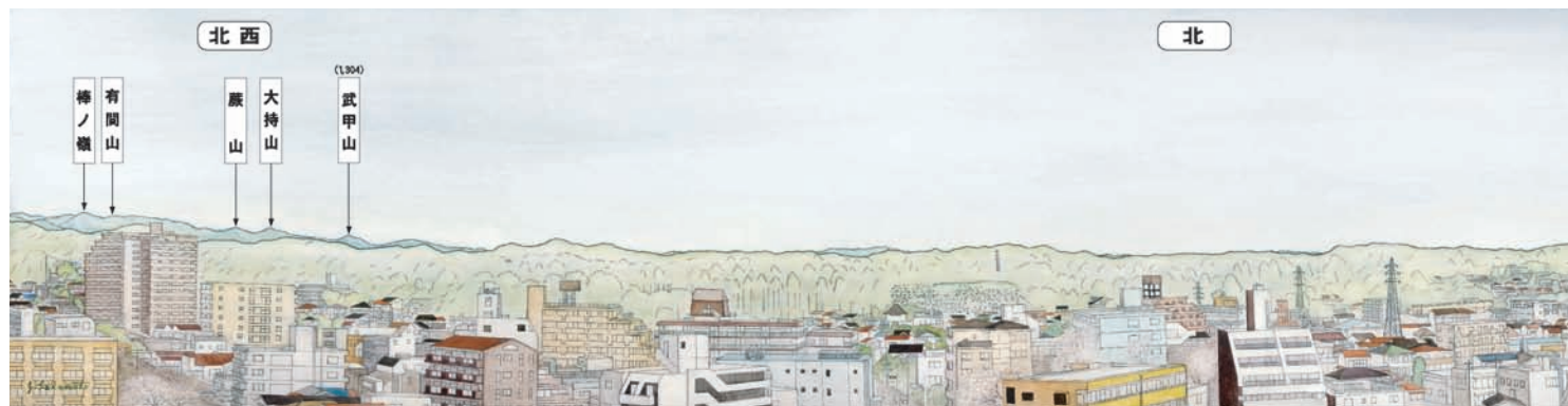
市役所7階テラスから見た山並み