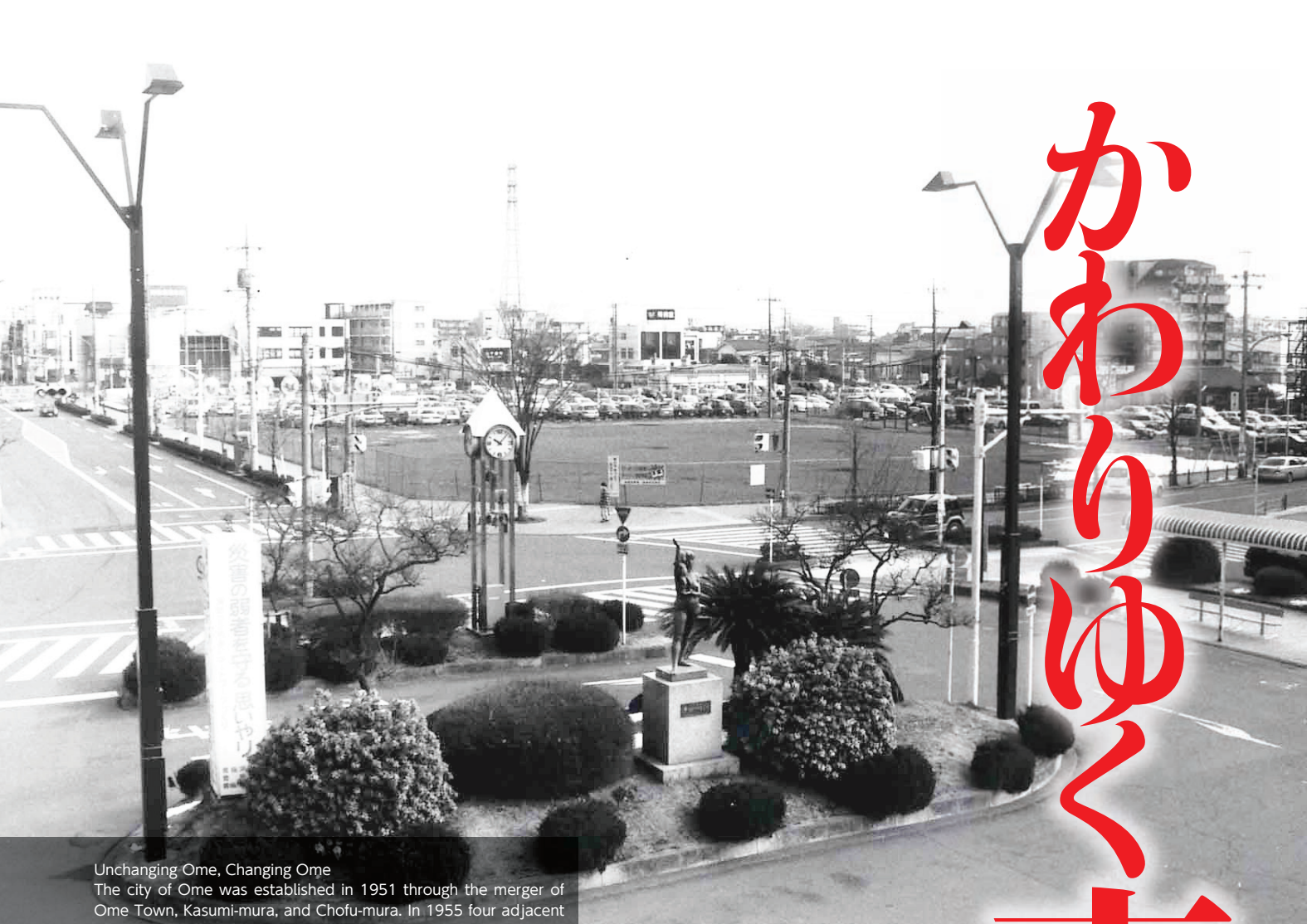
Unchanging Ome, Changing Ome The city of Ome was established in 1951 through the merger of Ome Town, Kasumi-mura, and Chofu-mura. In 1955 four adjacent villages (Yoshino, Mita, Osoki, and Nariki) joined the city to form the Ome that we know today. Sixty years later, while the beautiful nature remains unchanged, the living environment has been improved and the city has achieved steady development.