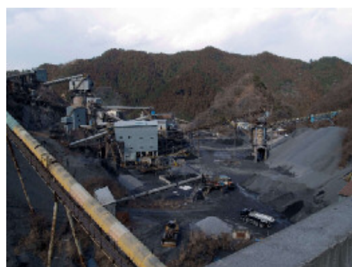
市内採石場の様子