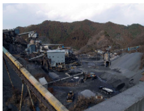
市内採石場の様子