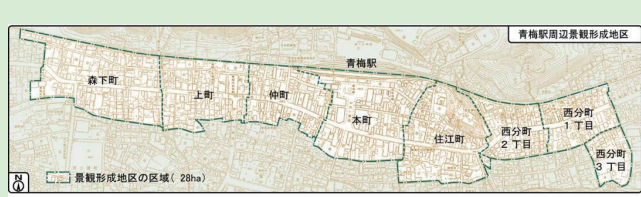
図1 青梅駅周辺景観形成地区の範囲

市では、「美しい風景都市・青梅」を目指し、優れた景観を持つまちづくりを進めるため、「青梅市の美しい風景を育む条例」に基づき、建築行為等について届け出を義務付けています。なお、重点的に景観形成を図る地区として指定している「青梅駅周辺景観形成地区」(図1)および「多摩川沿い景観形成地区」(図2)と、その他の「一般地区」では、届け出の対象が異なります。