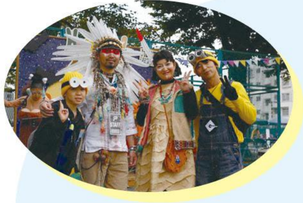
ハロウインの様子