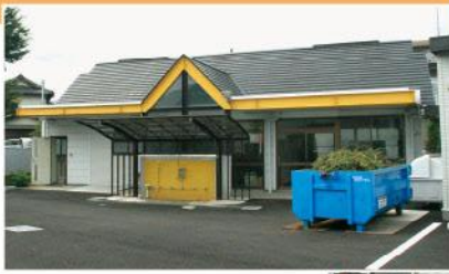
旧保育園舎を 利用している作業場