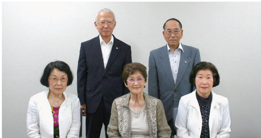
高齢者クラブ連合会

今号では、高齢者の仲間づくり、いきがいづくりなどのさまざまな活動をしている高齢者クラブ連合会のみなさんに高齢者クラブとは何か、また活動の様子についてうかがいました。