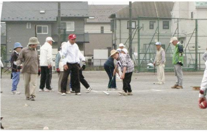
ゲートボール大会

自治会回覧、個別訪問、なにかの行事の際など勧誘は常に行っているのですが、実際には年度末前後の入会が多いです。