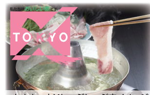
トウキョウXしゃぶしゃぶ肉イメージ