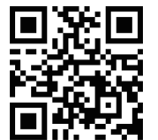
△青梅マラソン公式ホームページ