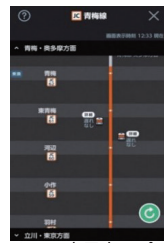
△JR東日本アプリ

JR東日本 きつぷを受け取ることなく非対面・非接触で特急列車に乗車できる「えきねっとチケットレスサービス」を展開しています。またJR東日本アプリ/どことレでは、時刻表や現在の青梅線の列車の走行位置などを案内しています。