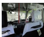
△飛まつ感染防止シート

京王自動車 高齢の方や、子育てで忙しい方を対象に「京王すまいるサポートタクシー」のサービスを提供しています。また新型コロナウイルス感染症拡大防止のため、乗務員のうがい、手洗い、車内消毒実施を励行しています。 都営バス 従来の1人乗りベビーカーに加え、2人乗りベビーカーも折りたたまずに乗車できます。 西武バス 「バスにおける新型コロナウイルス感染症予防対策ガイドライン」（日本バス協会作成）に基づき、安心してご乗車いただくための各種取り組みを実施しています。 西武バス 運転席横のカーテン設置、前方の座席の封鎖、車内換気や定期的な消毒、従業員の体調確認やマスクの着用等、さまざまな感染予防対策を実施しています。また、全車両で、抗菌・抗ウイルス対策のための車内コーティングを施工しました。