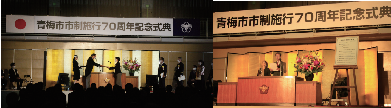
△表彰状贈呈の様子