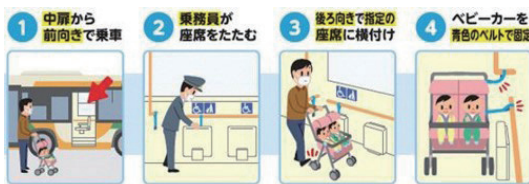
△二人乗りベビーカーの乗り方