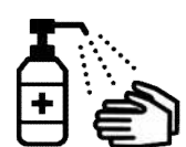
手指消毒用アルコール による消毒の励行

新型コロナワクチンの有効性・安全性などの詳しい情報については、厚生労働省ホームページの「新型コロナワクチンについて」のページをご覧ください。