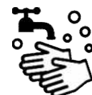
石けんによる 手洗い