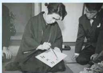
吉川英治と長男の英明(1957年頃)

本展示では、吉川英治の直筆原稿をはじめ、英治と親交があった菊池寛、川端康成、室生犀星など青梅市が所蔵する直筆原稿や書簡などを紹介するとともに、描き下ろしイラスト「納涼ノ憩イ」およびキャラクターパネルの展示やグッズの販売をおこないます。