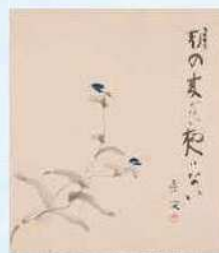
吉川英治直筆色紙(部分)