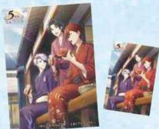
クリアファイル+ポストカードセット販売