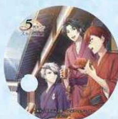
夏季展示期間中、入館された全ての方に丸うちわ(非売品)をプレゼント