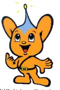
警視庁キャラクター 「ピーボくん」