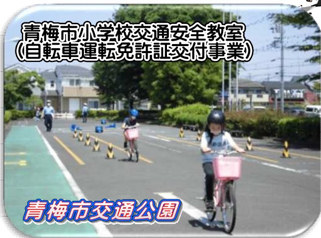
青梅市小学校交通安全教室 (自転車運転免許証交付事業)