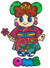
市公式キャラクター 「ゆめうめちゃん」