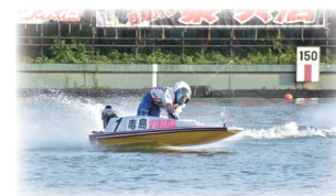
△ボートレース多摩川