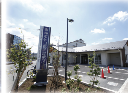
△休日夜間診療所の開設