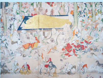
△天寧寺の仏涅槃図(拡大)