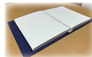
△資源物・ごみ収集カレンダー点字版