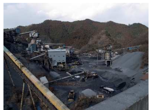
市内採石場の様子