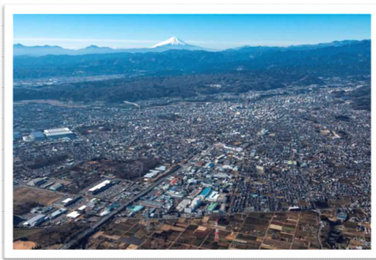
令和4年青梅市上空から (令和4年1月撮影)