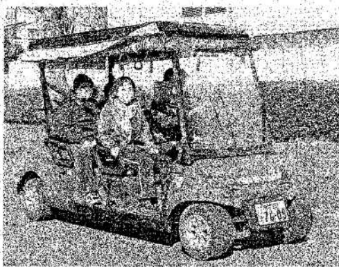
青梅市内の公道を試走する4人乗りの電動自動車

国土交通省が活用を推進し、全国各地で導入の動きが広がっている。両日行われた試乗イベントでは、窓のないカート型の4人乗り車両が使用された。同市河辺町の「住友金属鉱山アリーナ青梅」をスタートし、時速20キロ未満でJR河辺駅南口や青梅市立総合病院前の公道を、約8分かけて周回した。