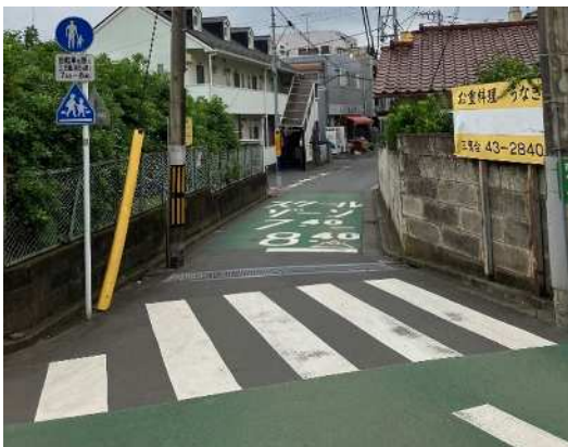
スクールゾーンでの運行