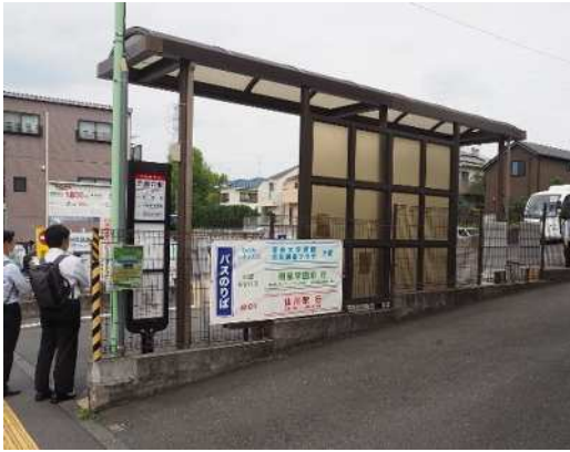
三鷹台駅バス乗り場（道路は左側）