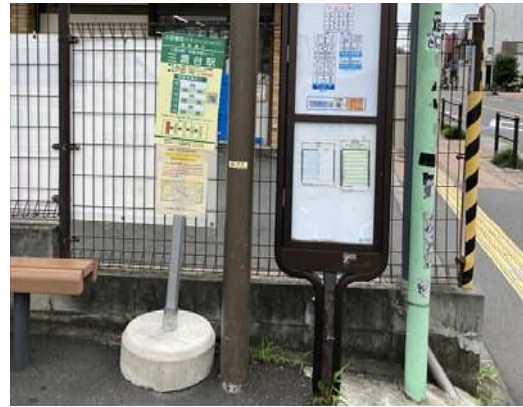
三鷹台駅「井のバス」バス停（左）