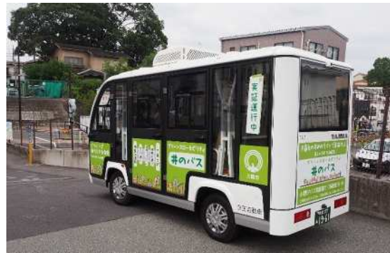
側面に「実証運行中」の札を掲げて運用