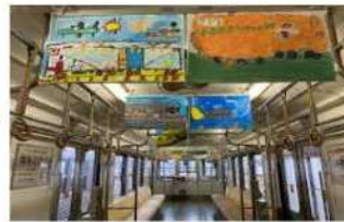
【車内掲出イメージ】 青梅線1編成4両に掲出 中吊り・まじろ・ドア横に最大398枚掲出可