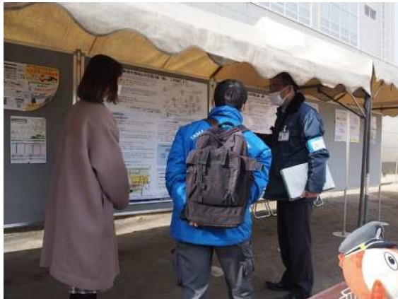
パネル展示(青梅市グリス口試乗会)