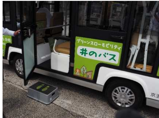
補助員によるステップ出しと開閉 （内側からの開閉は不可）