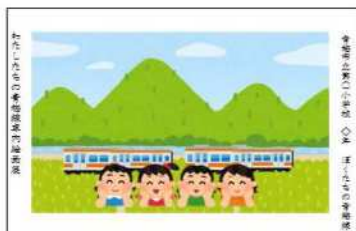
【ポスターイメージ】 児童が作成した絵画（A4版用紙）をスキャン拡大してB3版用紙（絵画サイズは487mm×309mm）で掲示 （掲載情報：学校名、学年、絵のタイトル）