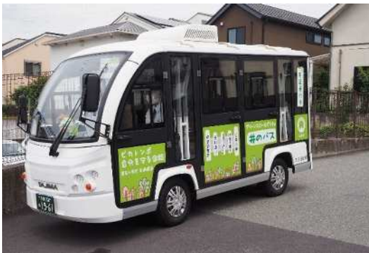
「井のバス」車両（全長4.05m、全幅1.5m、全高2.3m）