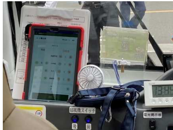
車載機器、乗降カウントタブレット