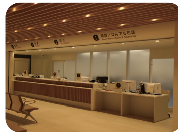
△1F初診 / なんでも相談室

▷初めて診察を受ける方…初診/なんでも相談にお越しください。 ▷事前予約（再診）の方…再来受付機にて受付手続きを行ってください。