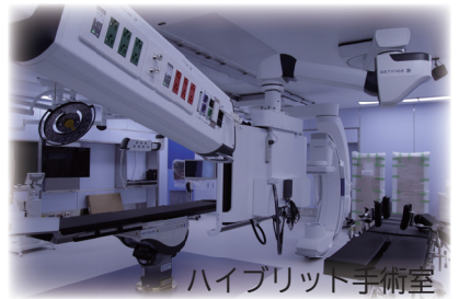
ハイブリッド手術室