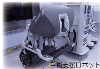
手術支援ロボット