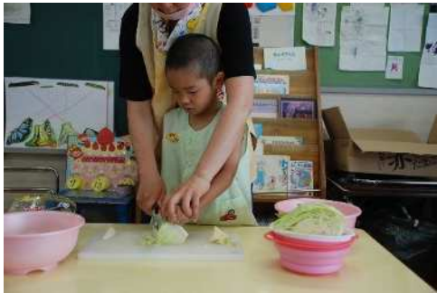
ホットドック作り