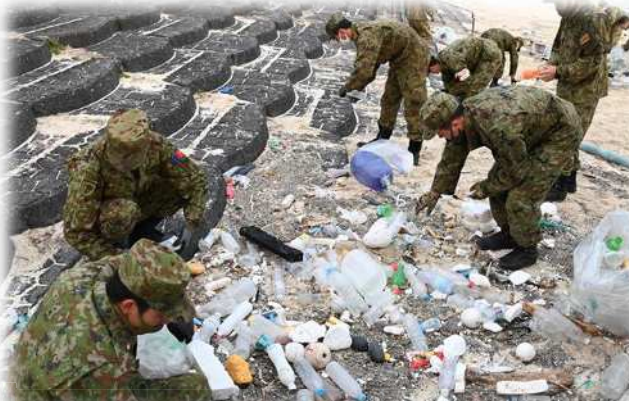
地域貢献活動（海岸清掃）