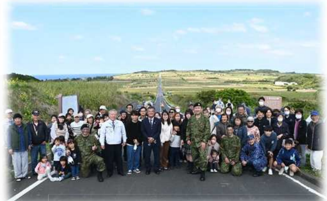
地域交流（集合写真）