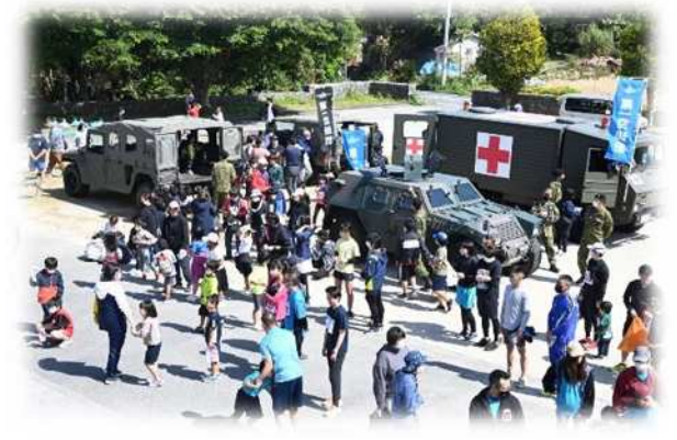
地域貢献活動（装備品展示）